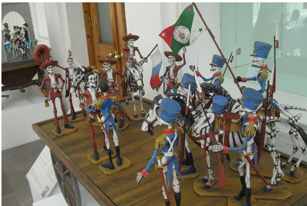
ABRAZO DE ACATEMPAN ENTRE ITURBIDE Y GUERRERO. MAQUETA EXPUESTA EN EL MUSEO DE LAS ARTES POPULARES, CD. DE MÉXICO.

Dice Pío Moa en su libro Los intelectual, dispensa práctica y dispensa