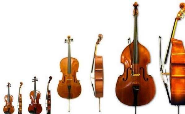
La familia de cuerdas se compone de 4 instrumentos; El violín, la viola, el violoncello y el contrabajo, todos de tamaños distintos.