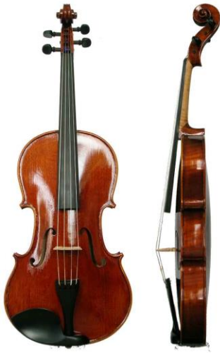
La viola es de apariencia similar a un violín, pero es un poco más grande